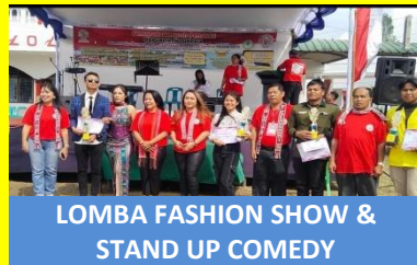
LOMBA FASHION SHOW & STAND UP COMEDY