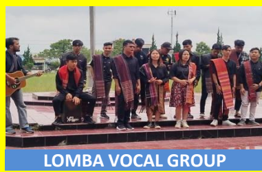
LOMBA VOCAL GROUP