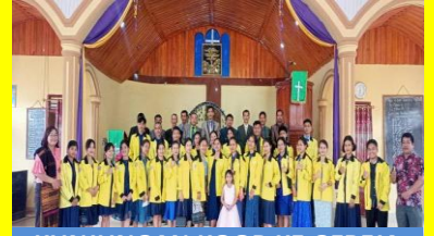
KUNJUNGAN KOOR KE GEREJA