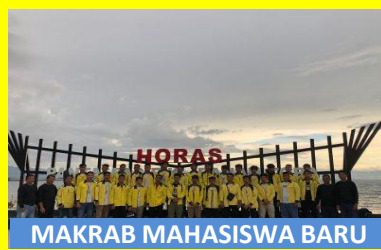
MAKRAB MAHASISWA BARU