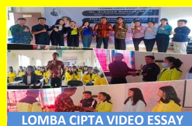
LOMBA CIPTA VIDEO ESSAY