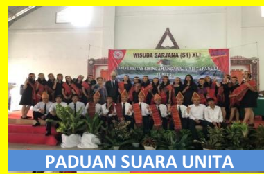
PADUAN SUARA UNITA